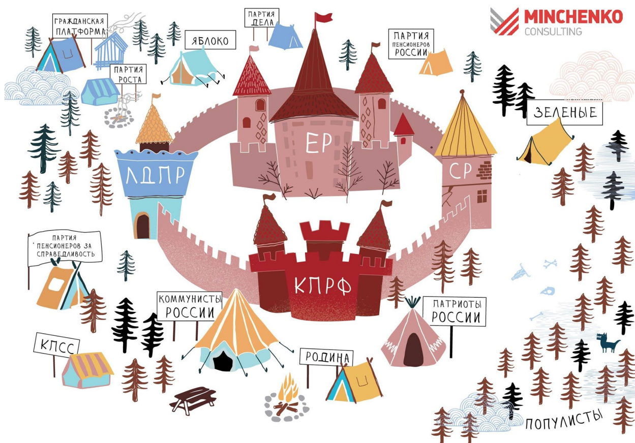
Иллюстрация №1. Экосистема российских политических партий

База правящей элиты, «детинец» ее крепости, партия «Единая Россия», демонстрирует достаточно высокую степень устойчивости даже в условиях снижения рейтингов власти. В частности, этому способствует система конкурентных праймериз, позволяющая тестировать электоральную эффективность потенциальных кандидатов на выборы разного уровня и обновлять состав элит за счет «свежей крови». Однако можно предположить, что посткрымские экстремумы рейтинговых показателей для ЕР остались в прошлом.